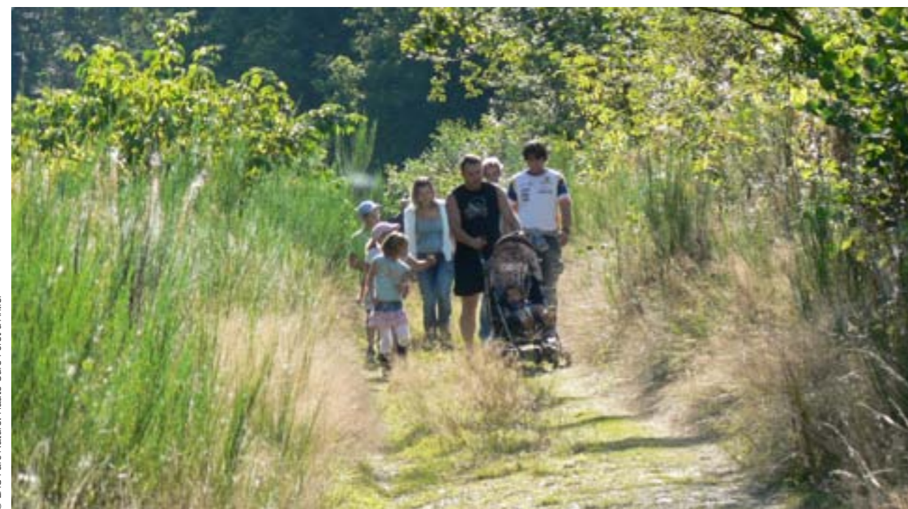
© LAG Parc Naturel Haute-Sûre Forêt d'Anlier