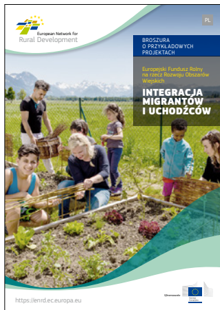
Integracja migrantów i uchodźców