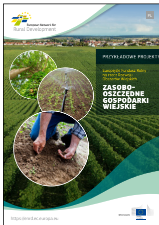
Zasobooszczędne gospodarki wiejskie