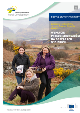
Wsparcie przedsiębiorczości na obszarach wiejskich