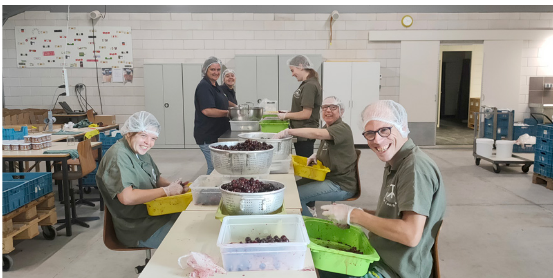
Gospodarstwo rolne zatrudnia 11 osób o specjalnych potrzebach, które zajmują się także przetwarzaniem produktów rolnych.