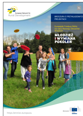
Młodzież i wymiana pokoleń