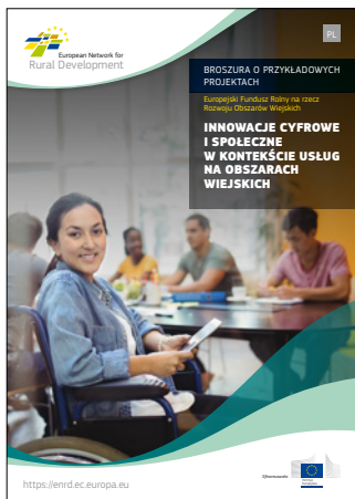
Innowacje cyfrowe i społeczne w kontekście usług na obszarach wiejskich