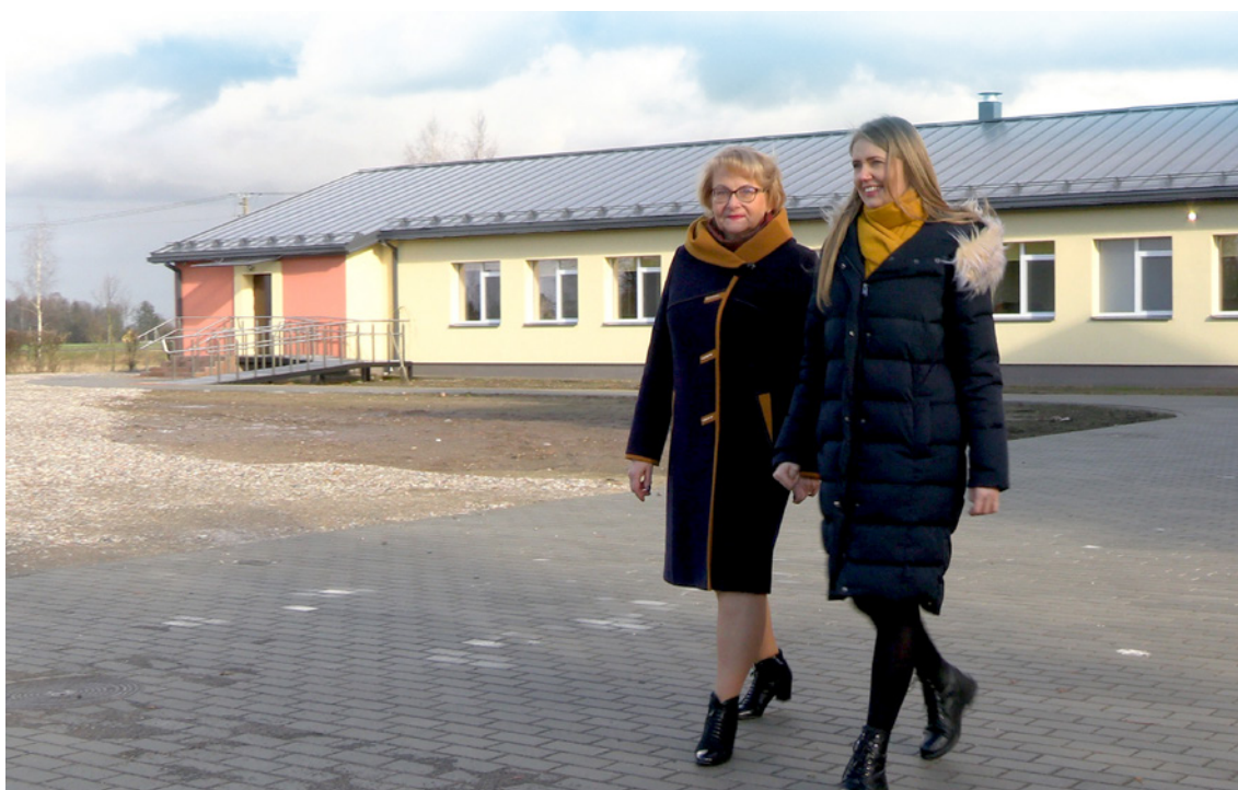
Lokalna grupa działania funkcjonująca w okręgu kowieńskim wspólnie z lokalną ludnością opracowała projekt LEADER i pomogła lokalnej ludności w uzyskaniu finansowania i potrzebnych pozwoleń od władz gminy.

Nowy ośrodek zapewnia zakwaterowanie dla 30 osób starszych oraz zatrudnienie w pełnym wymiarze czasu pracy dla 18 lokalnych mieszkańców. Są to różne stanowiska pracy, a jednym z zadań nowych pracowników