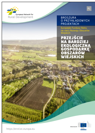
Przejście na bardziej ekologiczną gospodarkę obszarów wiejskich