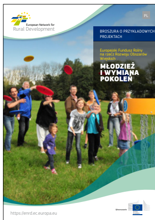
Młodzież i wymiana pokoleń