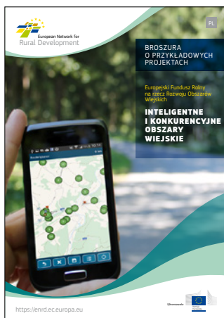
Inteligentne i konkurencyjne obszary wiejskie