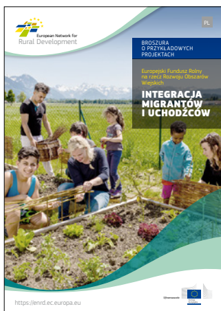
Integracja migrantów i uchodźców