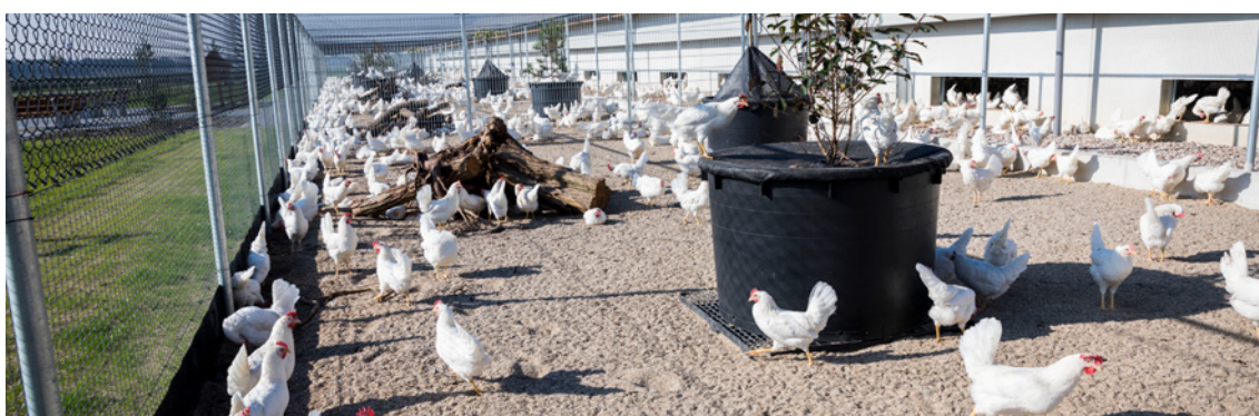
Ten projekt zwiększył rentowność przedsiębiorstwa, a jednocześnie przyczynia się do poprawy dobrostanu zwierząt.