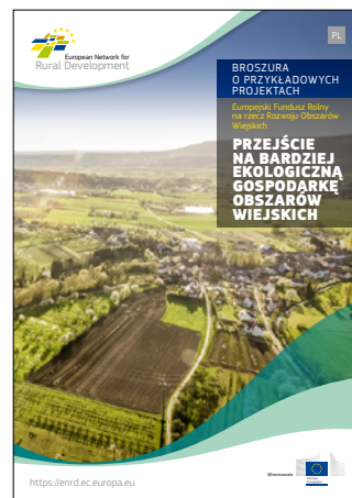
Przejdźcie na bardziej ekologiczną gospodarkę obszarów wiejskich