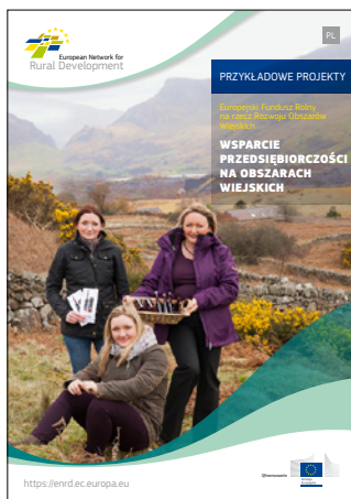
Wsparcie przedsiębiorczości na obszarach wiejskich