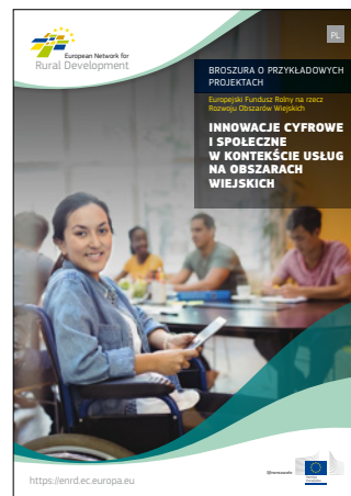
Innowacje cyfrowe i społeczne w kontekście usług na obszarach wiejskich