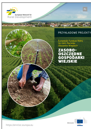
Zasobooszczędne gospodarki wiejskie